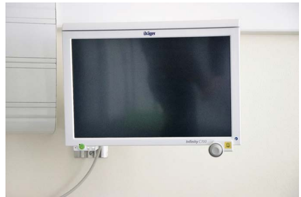
Monitor de sinais vitais