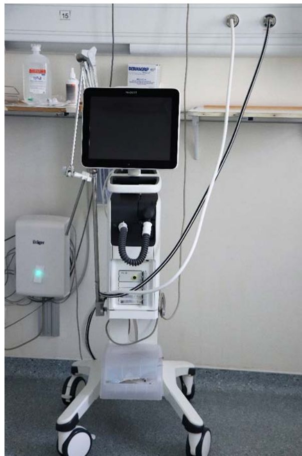
Ventilador UCI Adulto